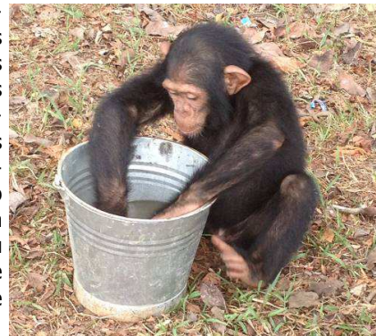
Un chimpanzé de Pongo... qui fait la vaisselle!

Les gardes font aussi de la prévention auprès des enfants du village. Ils les rassemblent pour leur expliquer qu'il ne faut pas chasser les animaux, parce que s'il n'y a plus d'animaux, les touristes ne viendront pas le voir. Car lorsque les animaux sont nombreux les touristes viennent et ça rapporte beaucoup d'argent. Grâce à cet argent, l'eau courante a pu être installée dans le village.