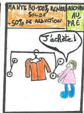
LISEZ L'ARTICLE SUR LES ANIMAUX D'ÉLEVAGE!