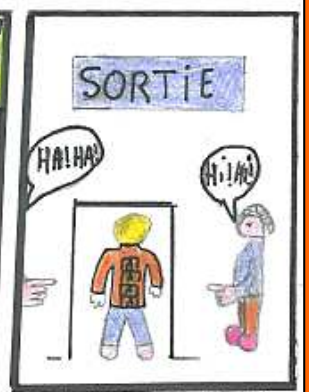
ON Y PARLE AUSSI DE MOI!